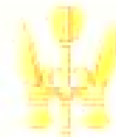
Варіант прапора (оригінал) (виповсюди) (виповсюди)

ВСЕУКРАЇНСЬКА АСОЦІАЦІЯ МАГІСТРІВ ДЕРЖАВНОГО УПРАВЛІННЯ